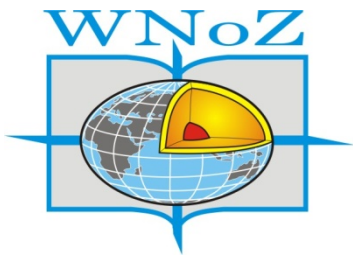
Wydział Nauk o Ziemi UŚ w Sosnowcu