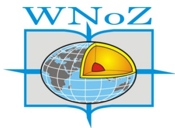
Wydział Nauk o Ziemi UŚ w Sosnowcu